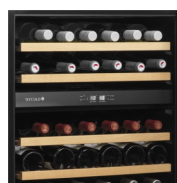
Деревянные выдвижные полки